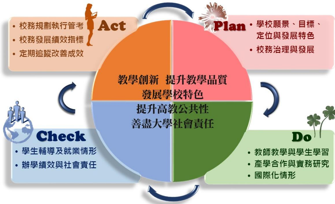
本校校務發展 PDCA 機制圖

108 年度起，在「宏國德霖 7-UP」基礎上，明確系科發展特色、加強學院整合精進，以「宏國德霖 TOP10」總計畫，邁向「永續生存、企業最愛」的願景。整體計畫滾動式修正聚焦在課程面上，由三個學院主導發展務實創新、就業導向之課程，培養學生專業務實與職場接軌的能力，為其迎向就業市場增值，開闢職場藍海。